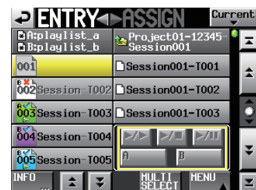
Kein Take zugewiesen (Eintragsseite)

Wenn einem Eintrag kein Take zugewiesen ist oder kein Eintrag ausgewählt wurde, sind die Schaltflächen abgeblendet, wie in den folgenden Beispielen gezeigt: