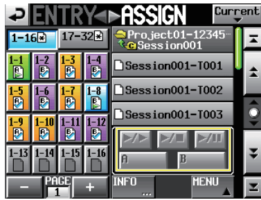
Kein Take ausgewählt (Zuweisungsseite)