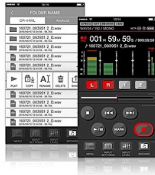
DR Control: Fernbedienungs-App für Recorder der DR-Serie