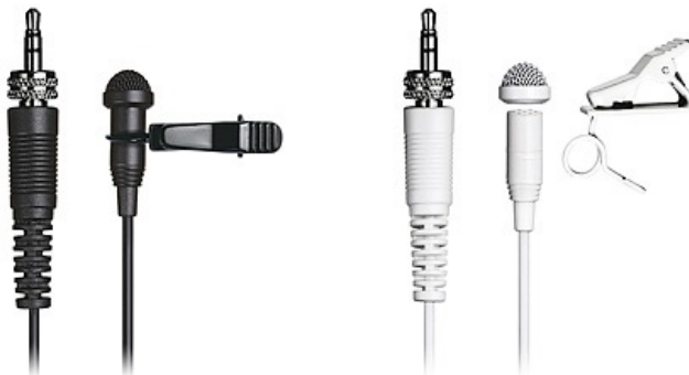
TM-10L: Lavalier-Mikrofon mit verschraubbarem Stecker