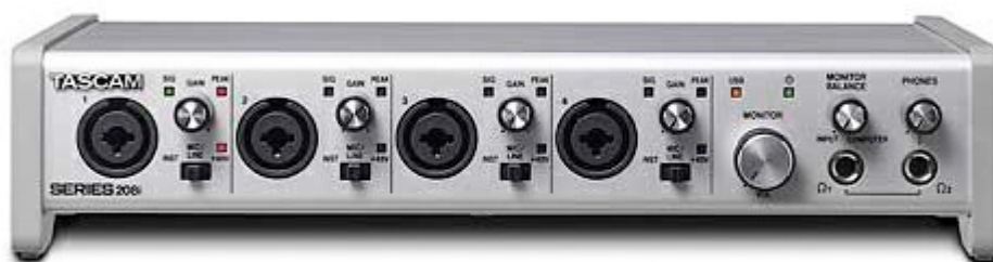
SERIES 208i: USB-Audio-/MIDI-Interface mit DSP-Mixer (20 Eingänge, 8 Ausgänge)