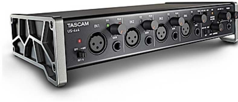
US-4x4: USB-Audio-/MIDI-Interface (4 Eingänge, 4 Ausgänge)