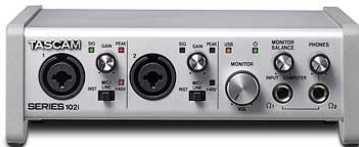
SERIES 102i: USB-Audio-/MIDI-Interface mit DSP-Mixer (10 Eingänge, 4 Ausgänge)