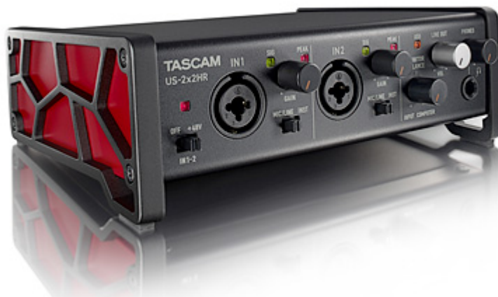
US-2x2HR: Hochauflösendes USB-Audio-/MIDI-Interface (2 Eingänge, 2 Ausgänge)